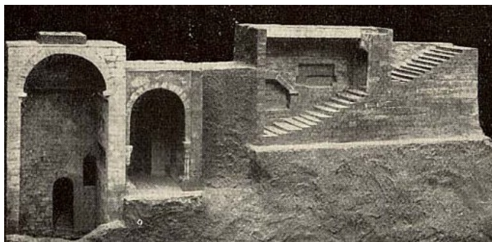
Модель шпайерской миквы 1911года