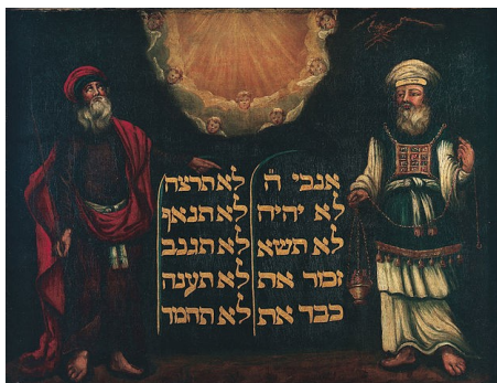
Картина неизвестного художника из Еврейского музея Лондона

Известен феномен Голливуда: все знают актера, хотя он все время на вторых ролях и за это даже получил «Оскара». Так и с Аароном: хотя он имел почетный сан Первосвященника и описан в Торе как образцовый персонаж, в еврейском искусстве его не дозволено изображать в одиночестве. Будь то на щитах для Торы или в библейских сюжетах. Аарон чаще всего служит «дополнением» к Моше. И даже описанный в сегодняшней недельной главе цветущий посох редко встречается в искусстве – чаще в качестве его атрибутов изображают нагрудник и сосуд для бесамим (пряностей).