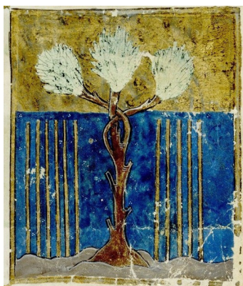
Цветущий посох Аарона среди 12-ти посохов. Из коллекции лондонской Британской библиотеки «Еврейская антология Северной Франции» (1277–1286).