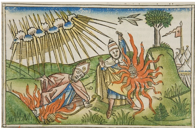
«Надав и Авигу». Ксилография Антона Кобергера (1440–1513)

В завершение даются некоторые законы ритуальной чистоты, в том числе об очищающей силе миквы (водоема с определенными критериями).