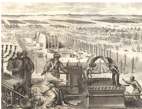
Возведение Мишкана. Иллюстрация 1728 г.

Подсчитываются пожертвования людей для строительства Мишкана из золота, серебра и меди. Бецальель, Охолиав и их помощники производят восемь предметов одежды священников: передник, нагрудник, плащ, корону, шляпу, тунику, пояс и брюки – в соответствии с точными инструкциями, которые Моисей получил в главе Торы «Тецавэ». Мишкан завершен, и все его компоненты доставлены Моисею, который строит его и освящает его священным маслом для помазания. Он также помазывает Аарона и его четырех сыновей на служение. Облако появляется над Мишканом, указывая на то, что в нем обитает Б-жественное Присутствие.